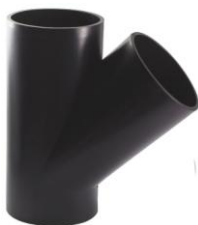
Тройник 45 0